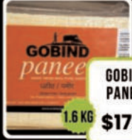
GOBIND PANEER 1.6 KG $17.79