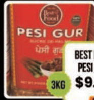
BEST FOOD PESI GUR 3KG $9.99