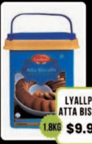
LYALLPUR ATTA BISCUIT 1.8KG $9.98