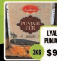
LYALLPUR PUNJABI GUR 3KG $9.99