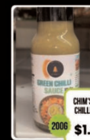
CHIM'S GREEN CHILLI SAUCE 200G $1.49