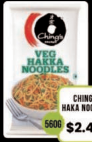
CHING'S HAKA NOODLES 560G $2.49