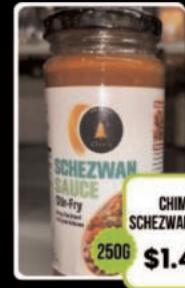
CHIM'S SCHEZWAN SAUCE 250G $1.49