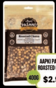
AAPKI PASAND ROASTED CHANA 400G $2.98