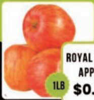
ROYAL GALA APPLE 1LB $0.98