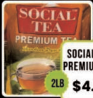
SOCIAL TEA PREMIUM TEA 2LB $4.98