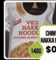
CHIM'S VEG HAKKA NOODLES 140G $0.79