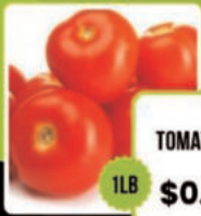
TOMATOES 1LB $0.99