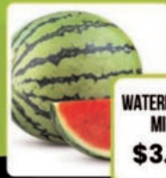
WATERMELON MINI $3.98