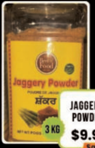
JAGGERY POWDER 3 KG $9.99