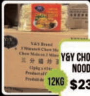
VEG CHOWMEIN NOODLES 12KG $23.98