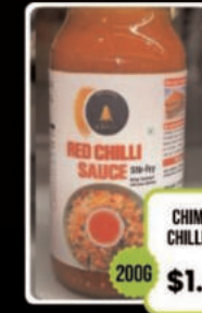
CHIM'S RED CHILLI SAUCE 200G $1.49