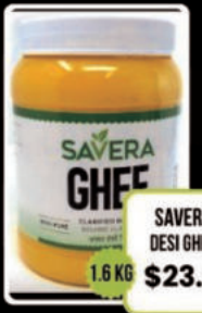
SAVERA DESI GHEE 1.6 KG $23.98