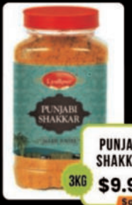
PUNJABI SHAKKAR 3KG $9.99