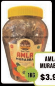
AML MURABBA 1KG $3.98